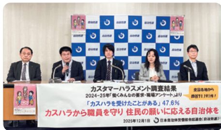
職場の現状や要求を記者会見で発信