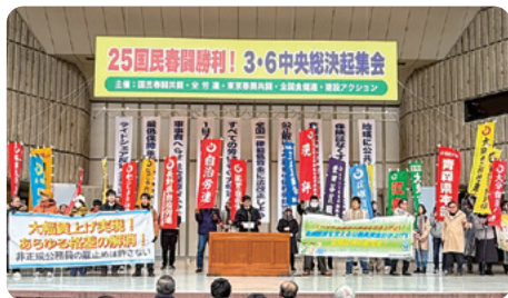
全国の仲間と要求を掲げる自治労連

自治労連は、各地にある自治体・公務公共職場の労働組合が加入している全国組織です。私たちの活動の根底にあるのは、「住民のためによりよい仕事がしたい!」という想いです。同じ想いをもつ仲間が全国で活動しており、力を合わせ、経験や情報を交流して知恵を出し合い、自治体だけでなく政府に対しても交渉や話し合いを行っています。