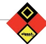
オリジナルロゴマーク(仮)

高知をはじめ四国から集まった青年による「よさこい鳴子踊り」で全国のみなさんを歓迎します!