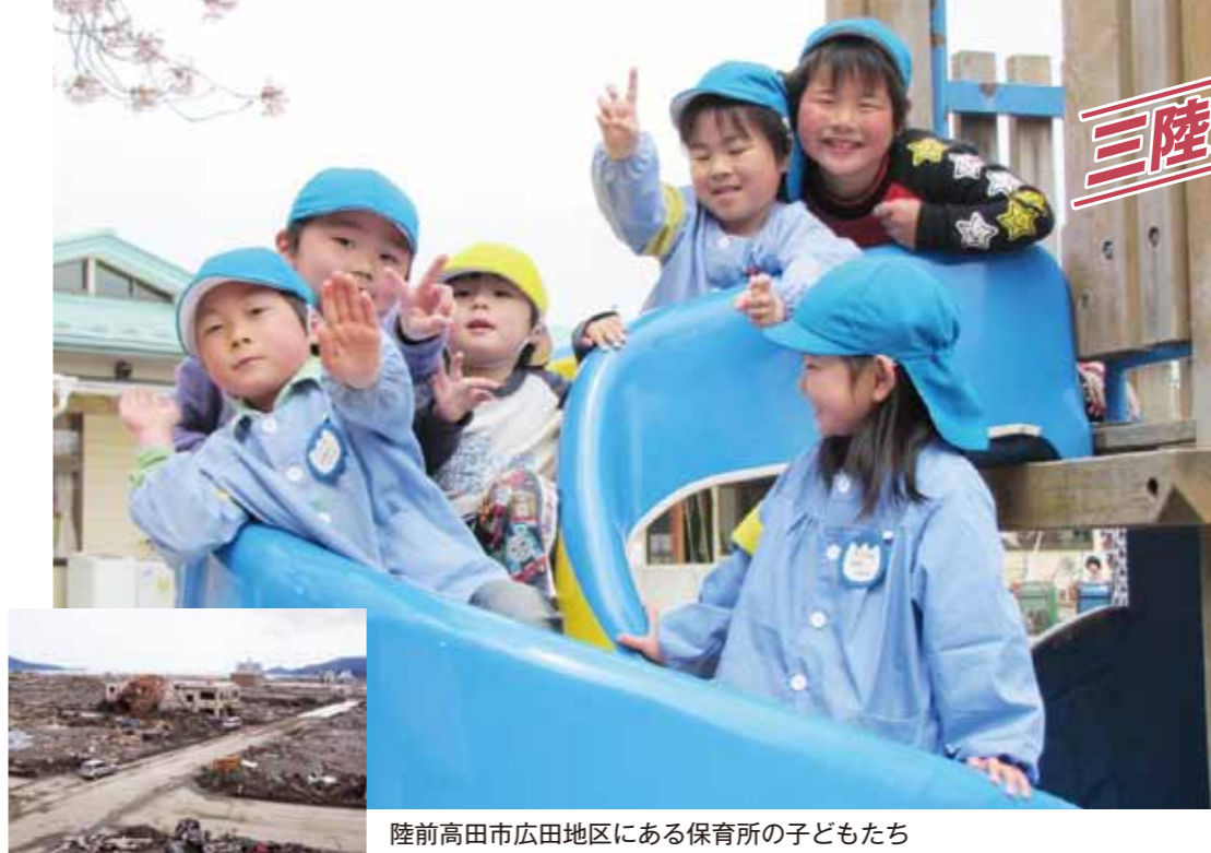
陸前高田市広田地区にある保育所の子どもたち