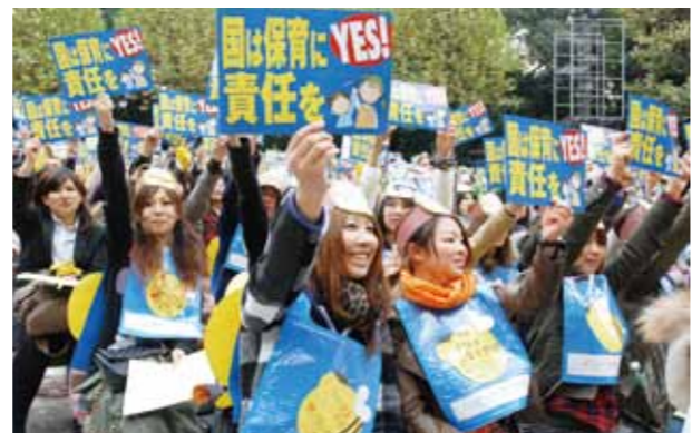
「つくろう保育所、こわすな保育制度、すべての子どもたちによりよい保育を」と11.14大集会に全国から4800人が結集。

「よりよい保育を！実行委員会」の国会請願署名は300万筆をこえ、昨年8月には参議院で請願が全会一致、採択されました。日本弁護士連合会は今年1月に「『すべての子ども』に保育を受ける権利を保障することと明らかに逆行する保育制度の介護保険化は、新システムに関する法案からは除くべきである」という意見書を政府に提出。大震災後も被災地の岩手県、福島県内の市町村議会をはじめ、全国で「新システム反対」の意見書が採択されています。